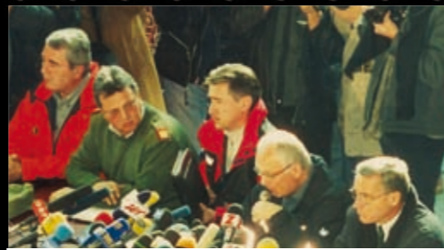
Pressekonferenz beim Einsatz Brandkatastrophe Kitzsteinhorn

Winter, im Beruf technischer und kaufmännischer Geschäftsführer des Müll-Entsorgers ZEMKA in Zell am See, seit 1978.