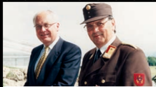
Eröffnung der Übungsstrecke mit LH Schausberger 1999