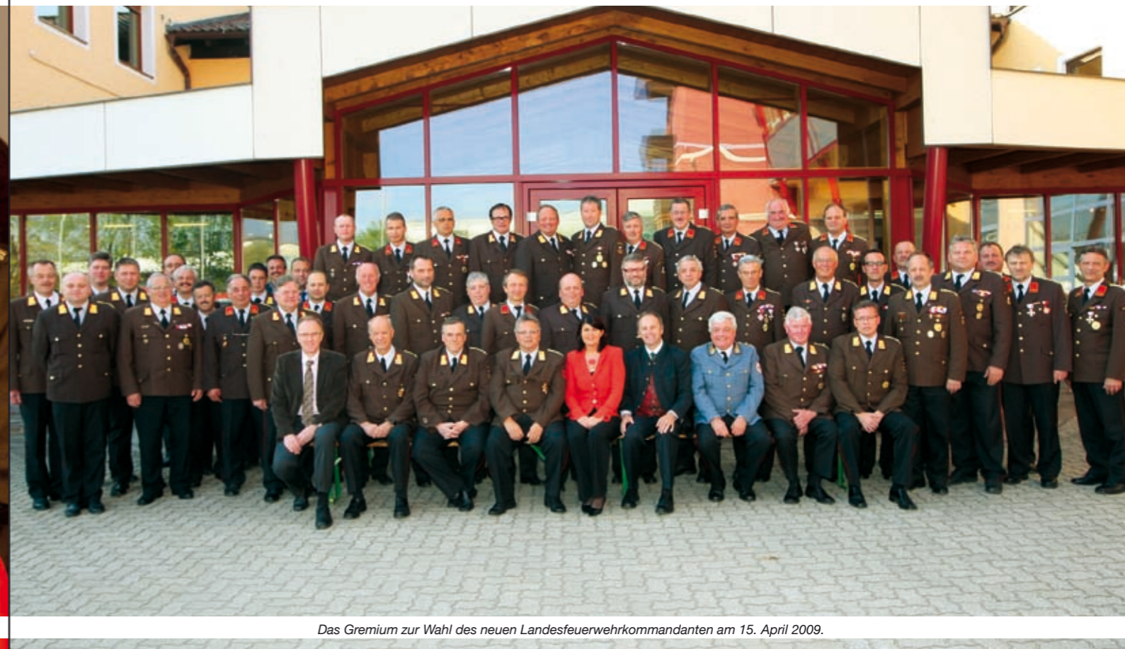
Das Gremium zur Wahl des neuen Landesfeuerwehrkommandanten am 15. April 2009.