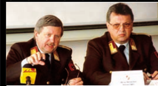
Pressekonferenz mit Präsident Seidl für den ÖBFV